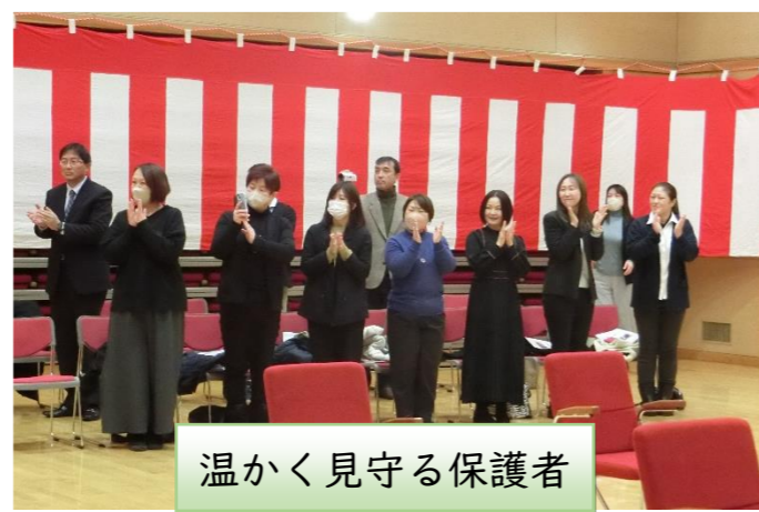
温かく見守る保護者