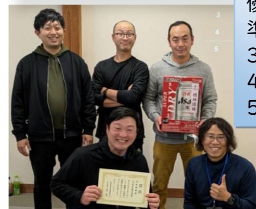
優勝した「荘川麻雀格闘倶楽部」の皆さん