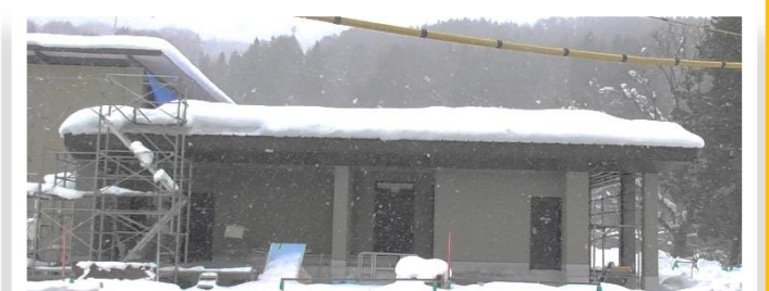
給食センターの外観完成

今シーズンは大雪でしたが、体育館の屋根雪下ろしをしながら作業されていました。 体育館の屋根が完成しています。 (2025年1月17日現在)